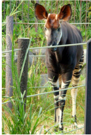
オカピ。寝ていて姿が見えないこともあるそうですが、元気な姿が見られました。

お土産としてサツマイモ1キロを貰い、身も心も大満足の1日でした。横浜市とは思えないような緑に囲まれた環境での農作業を、皆さん楽しまれていました。また来年も来ていものです♪