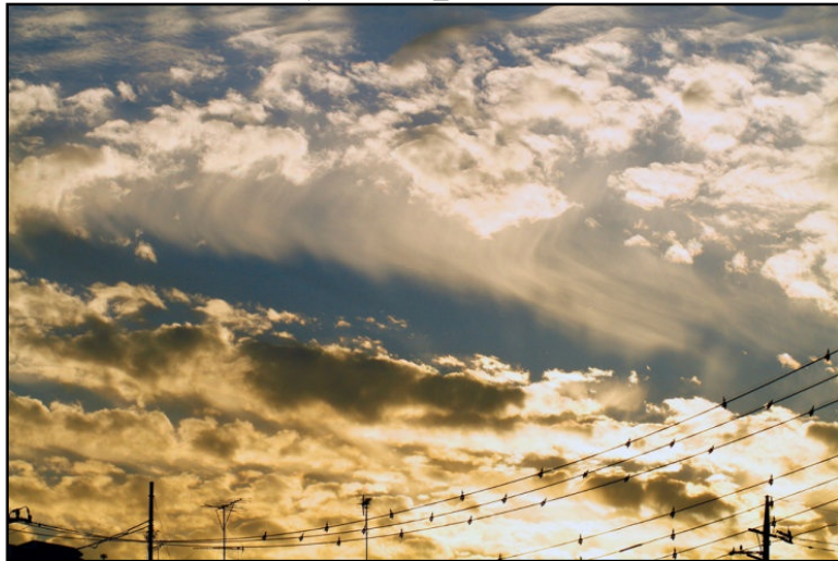
桜井慎治さんの作品です