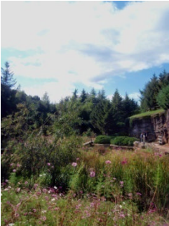
午下の写真がアラースの谷の様子です。