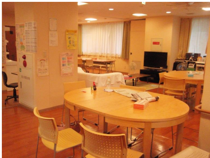
模様替え後のオリオンです

7月には、およそ2年ぶりにフリースペースの模様替えをしました。同時に25名を超える利用がある時間も増えてきたため、少し窮屈な様子があり今回の模様替えに至りました。変更時は少し違和感はあったかもしれませんが、1人あたりのスペースを保ちながら席数も確保。概ね好評をいただいているかなと思っています。現在のオリオンの写真を載せます。まだ実際に見ていない方は、これを機会にお越しください。